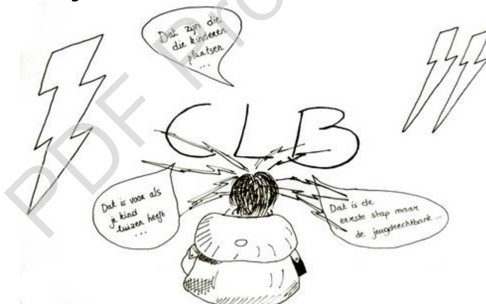
Illustratie : Een negatief imago. (Bron : 'Ouders in armoede en het CLB. Een andere kijk', 2014).

De ouders hebben het gevoel er naartoe te moeten omdat hun kind iets fout heeft gedaan of omdat het niet slim genoeg is. De ouders hebben het gevoel dat hun kinderen een stempel krijgen wanneer ze naar het CLB moeten. Er is angst voor