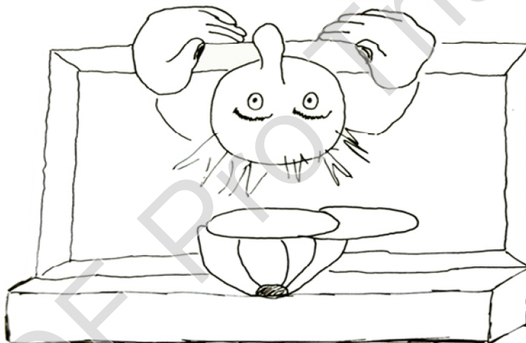
Illustratie : Het CLB, een andere kijk..

Uit de dossiers en het overleg blijkt dat ouders in armoede het CLB een centralere rol willen geven, als brug tussen leerlingen, ouders en leerkrachten/directies. Een 15tal aandachtspunten onderstrepen dit ideaal.